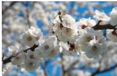
Meruňky kvetou na začátku jara – a to bílými či bledě růžovými květy.