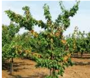
Meruňka je velmi citlivý strom. Je náročný na půdu i na teploty.