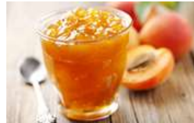
Oblíbené jsou meruňky také sušené nebo z nich vyrobený džem či marmeláda.