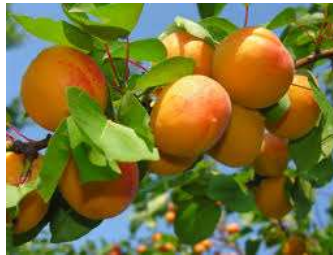
Chuťově nejlepší jsou ty tuzemské, zbarvují se do oranžova s načervenalými líčky.