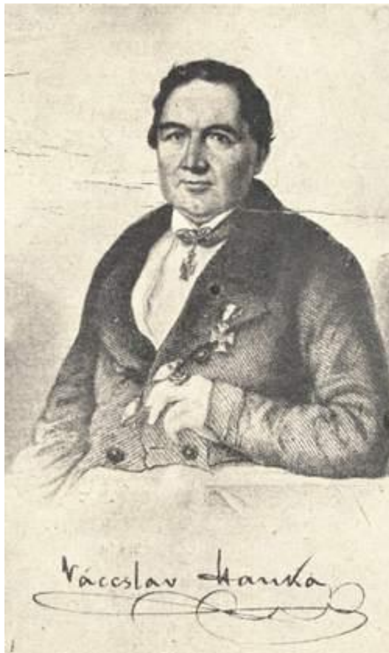
Václav Hanka, pravděpodobně autor padělaných rukopisů