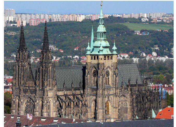
Katedrála svatého Víta, Václava a Vojtěcha