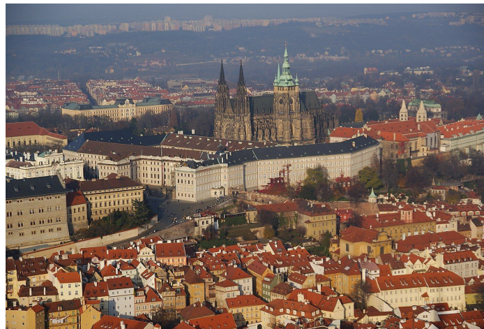
Pražský hrad je největší souvislý hradní komplex na světě